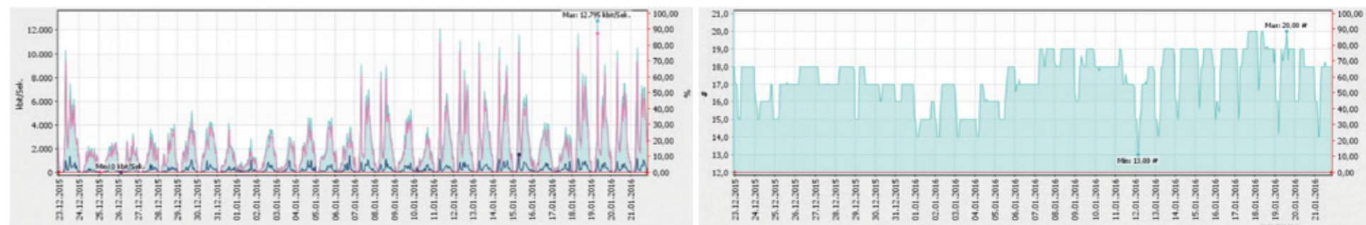
Beispielauswertungen des Systemmonitoring: genutzte Bandbreite (links), Anzahl Verbindungen (rechts)

Verfügbarkeit, Bandbreite und Auslastung Ihres WLANs können ebenso überwacht werden wie einzelne Fahrzeuge oder zentrale Services wie z. B. der Content Filter. Bei Erreichen von individuellen Schwellenwerten erfolgt ein automatisierter Versand von Alarmmeldungen per E-Mail oder SMS.